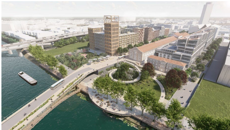
La place Olympique du Village des Athlètes – ©SOLIDEO–Kreaction–Clément Vergély architectes–Béal & Blanckaert architectes–Agence TER

1. Intégration élégante des contraintes de relief. Par exemple, sur le Village des Athlètes, nous devons proposer des solutions pour relier le point le plus haut du site et les bords de Seine, soit un dénivelé d'environ 12 mètres. C'est pourquoi les rampes nécessaires pour l'accès des personnes ne pouvant emprunter les escaliers ont été conçues comme des objets architecturaux travaillés et confortables pour tous les usages, notamment sur la place des Athlètes et sur la Promenade Cesaria Evora. Des rampes analogues sont également prévues au Village des Médias. Ainsi, l'accès nécessaire pour les personnes en situation de handicap devient l'accès principal, offrant à chacun un confort supplémentaire dans sa déambulation.