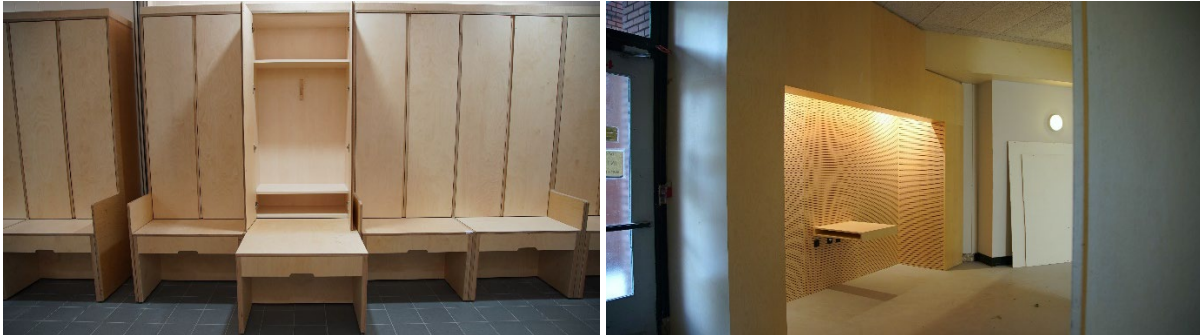
Vestiaire et exemple d'alcôve, Stade Pierre de Coubertin