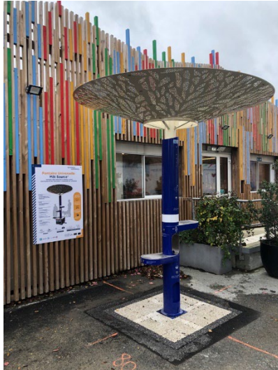
Fontaine universelle

Dans le cadre de sa démarche de mise en place d'un mobilier urbain inclusif, la SOLIDEO participe également au projet de « fontaine universelle » piloté par Eau de Paris. Il s'agit de développer et généraliser une fontaine durable et accessible à tous avec une distribution de l'eau à plusieurs niveaux et un design incitant à une consommation responsable. Un modèle de cette fontaine est installé depuis septembre 2022 à la Maison du projet du Village des Athlètes, permettant un test en conditions réelles. A terme, ce sont trois fontaines universelles qui seront installées sur la ZAC du Village.