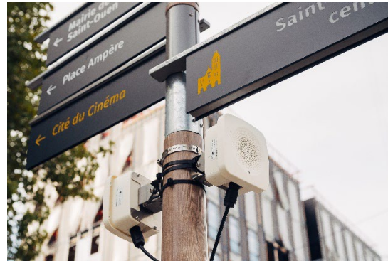
Eléments de la signalétique inclusive et multisensorielle

Après une phase approfondie de recherche et développement, complétée de deux sessions de tests utilisateurs, d'abord mi-mars 2022 puis en octobre de la même année, directement dans le quartier du Village des Athlètes, le projet a été finalisé. Des prototypes sont d'ailleurs exposés à la maison du projet de la SOLIDEO à Saint-Ouen-sur-Seine.