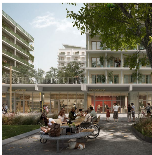
Mobilier inclusif sur la Promenade Cesaria Evora

Une procédure de dialogue compétitif a été lancée en novembre 2020 afin de trouver du mobilier parfaitement adapté à ces attentes et s'intégrant élégamment dans le vocabulaire urbain du village. Deux solutions ont été retenues et seront intégrées dans les espaces publics du Village des athlètes. Elles proposent du mobilier au dessin soigné répondant à tous les types de besoins. Au-delà de ce maillage, l'objectif est de permettre que les personnes en situation de handicap puissent partager des moments de convivialité avec les autres usagers (tables de pique-nique, zones de convivialité...);