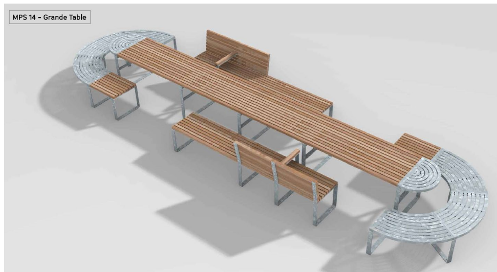
Exemple de mobilier urbain inclusif qui sera installé sur la Promenade Cesaria Evora à Saint-Ouen-sur-Seine, au sein du Village des Athlètes

A cet égard, plusieurs projets liés à l'accessibilité universelle ont bénéficié d'une subvention de la part du fonds d'innovation de la SOLIDEO, par exemple au travers d'un partenariat d'innovation pour le projet de signalétique inclusive multisensorielle sur le Village des Athlètes (avec un groupement composé de six structures : Okeenea, Polygraphik, Mengrov, Tactile Studio, Atipy et Empreintes) ou encore d'un dialogue compétitif sur la recherche de mobiliers urbains inclusifs.